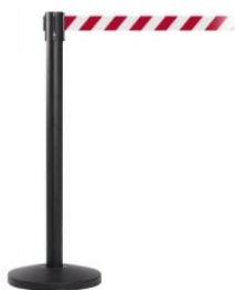
Gurtbandabsperungen Verschiedene Längen ab 79,00 EUR / Säule

Die Bedienung der Hand-Desinfektions-Säule erfolgt hygienisch über einen langen Hebel, der mit dem Ellenbogen gedrückt werden kann. Es ist nicht nötig den Spender mit der Hand zu berühren, um das Desinfektionsmittel aus der Flasche zu pumpen. So wird der größtmögliche Schutz des Nutzers erreicht und eine Übertragung von Viren und Bakterien vermieden. Mit der Edelstahl-Tropfschale wird der Bereich unter der Spenderflasche sauber gehalten.