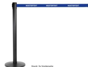
Gurtbandabsperung mit Logo Längen: 2,0-3,8m ab 119,00 EUR

Alle Preise netto, zzgl. 19% MwSt. und Versandkosten EUR 22,00 / Einzelversand Stand: 01.01.2010, gültig bis 30.04.2021