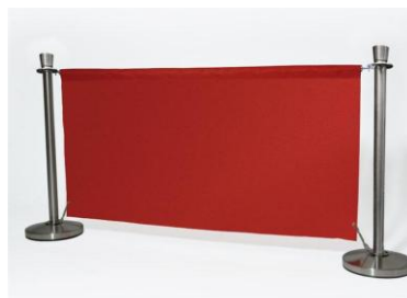
Absperrbanner bedruckbar Café- Barriere, ab 258,00 EUR Breite: 150 o. 200 cm, erweiterbar